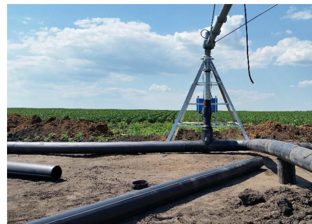
2019г. Устройство трубопровода. Земли сельскохозяйственного назначения ООО «Кимовские просторы» Кимовского района Тульской области