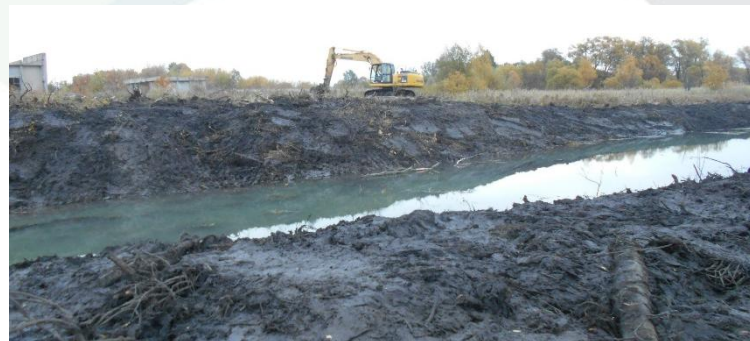
2018г. Очистка отводящего канала. ГТС водохранилища на р. Гущина Ряса у с. Митягино Лев- Толстовского района Липецкой области

Министерство сельского хозяйства ДЕПАРТАМЕНТ МЕЛИОРАЦИИ ФГБУ «Управление «ЛИПЕЦКМЕЛИОВОДХОЗ»