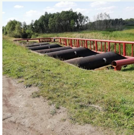
2019г. Восстановление ледозащиты. Плотина водохранилища на р. Ряса у с. Лозовка Чаплыгинского района Липецкой области

Министерство сельского хозяйства ДЕПАРТАМЕНТ МЕЛИОРАЦИИ ФГБУ «Управление «ЛИПЕЦКМЕЛИОВОДХОЗ»