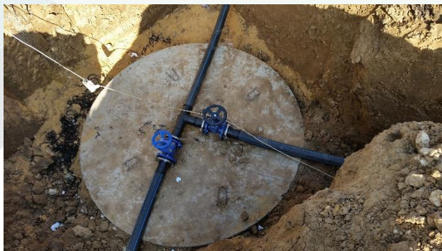
2019г. Устройство сетей водопровода. Земли сельскохозяйственного назначения АО «АПО «Аврора» Липецкой области