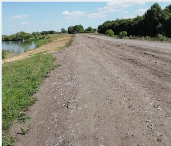
2019г. Планировка гребня плотины Плотина водохранилища на р. Ряса у с. Лозовка Чаплыгинского района Липецкой области

Проведение противопаводковых мероприятий