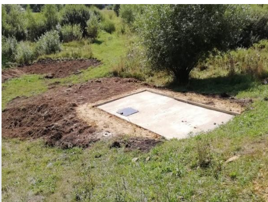
2019г. Ремонт колодца. Плотина водохранилища на р. Ряса у с. Лозовка Чаплыгинского района Липецкой области