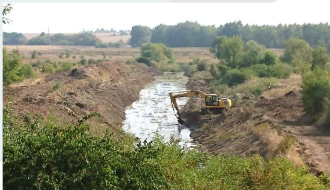
2018г. Очистка водоотводящих каналов ГТС водохранилища на р. Белоколодец у с. Пады Липецкого района Липецкой области

Проведение противопаводковых мероприятий