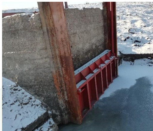
2018г. Восстановление работоспособности шандора. ГТС водохранилища на р. Усмать у с. Красное Усманского района Липецкой области