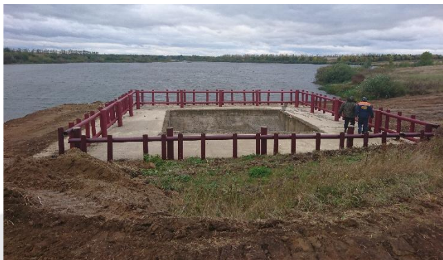
2018г. Ремонт шахты паводкового водосброса ГТС водохранилища на р. Гущина Ряса у с. Митягино Лев-Толстовского района Липецкой области