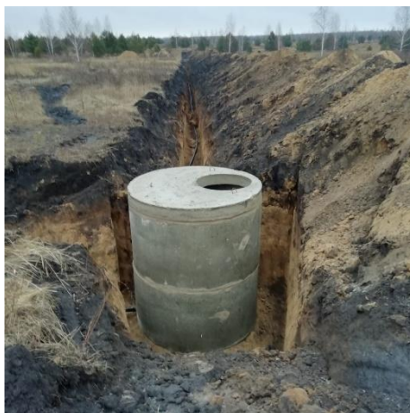
2019г. Устройство сетей водопровода. Водоснабжение жилой малоэтажной застройки с земельными участками в районе переулка Бодрый с. Желтые Пески г. Липецка»