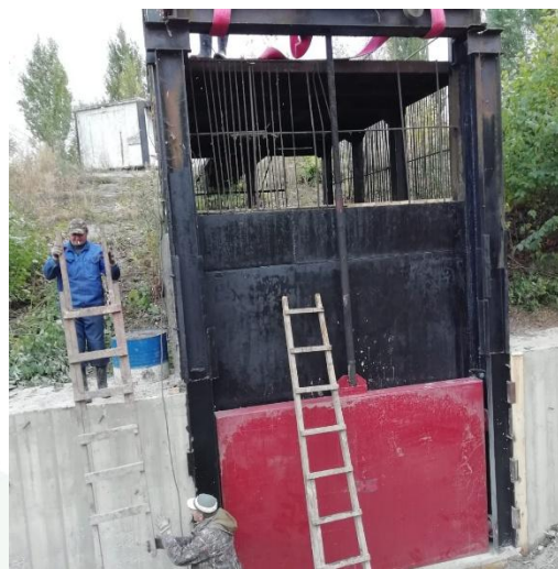
2019г. Ремонт шандора. Плотина водохранилища на р. Белоколодец у с. Пады Липецкого района Липецкой области